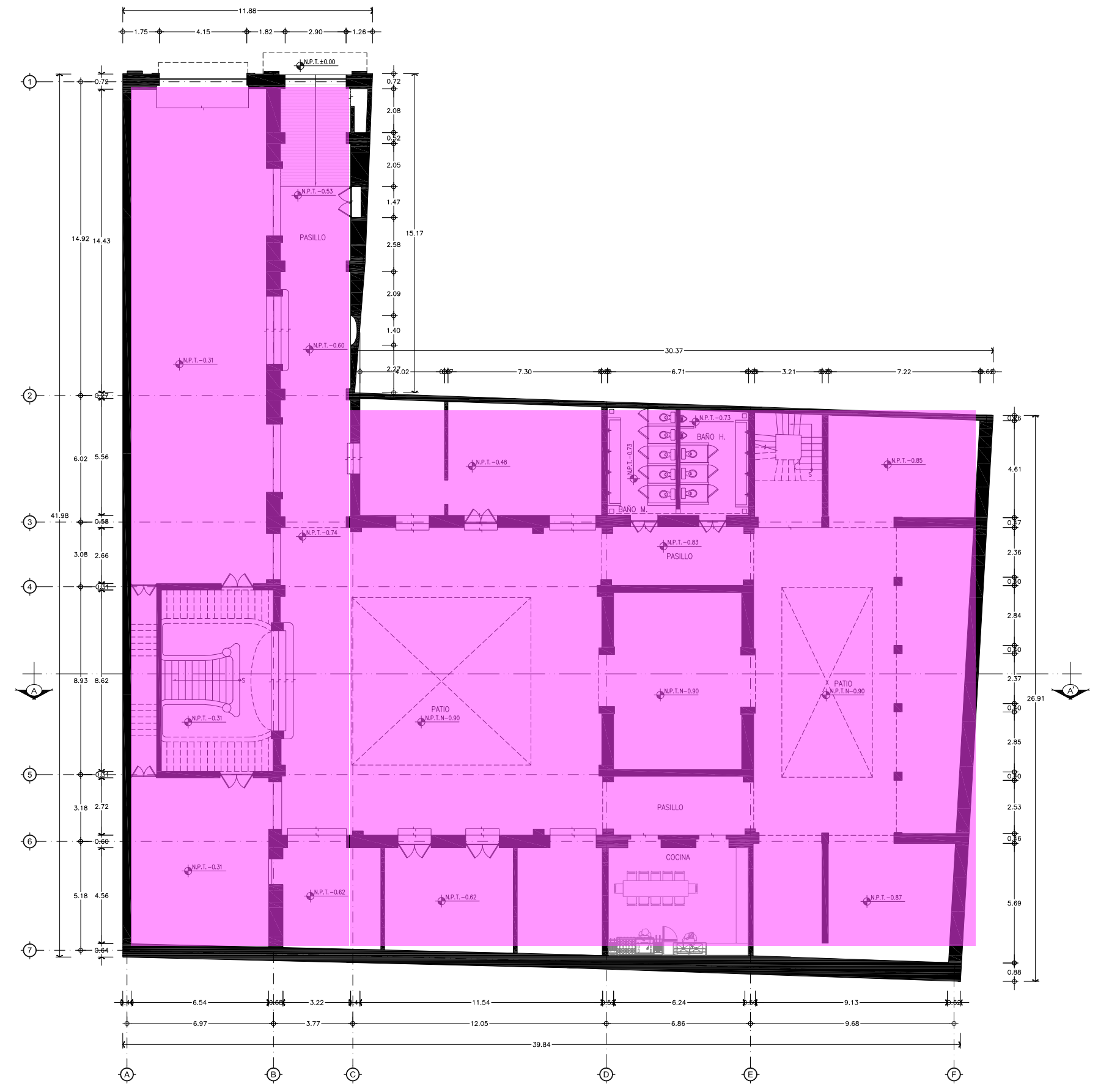
PLANTA BAJA ESCALA 1:100